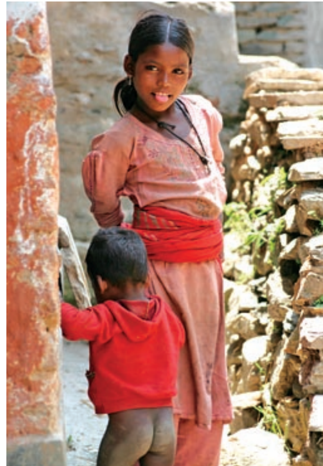
2. PŘI VYTVÁŘENÍ PORTRÉTŮ BÝVÁ UŽITEČNÉ POŘIZOVAT VŽDY SLED ZÁBĚRŮ, neboť stačí malá změna gesta a snímek je úplně jiný. I portrét někdy naznačí příběh. Nepálská dívka s bráškou, vesnice Tatopani, oblast Annapurny, Himálaje, Nepál