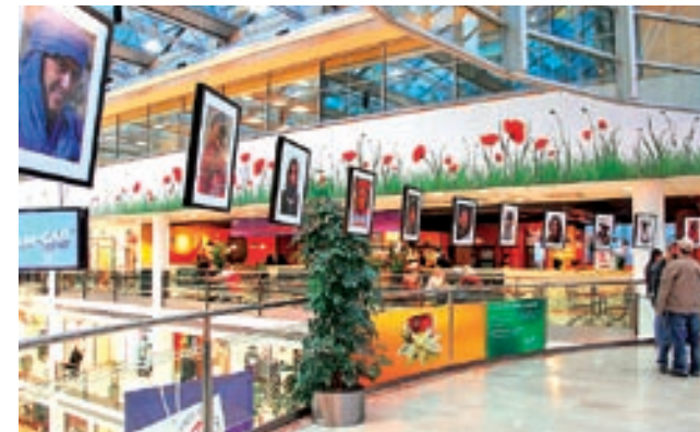
14. INSTALACE části autorčiny výstavy Barvy a tváře světa v paláci Flóra, kde výstava byla do 26. dubna 2009.

Zcela jednoznačně mi jde o co nejvyšší kvalitu autentického zachycení v terénu a maximálně dokonalý snímek bez větších zásahů. Na druhou stranu digitální úprava snímků dovoluje posunout snímky blíže realitě či vyzdvihnout kompozici či