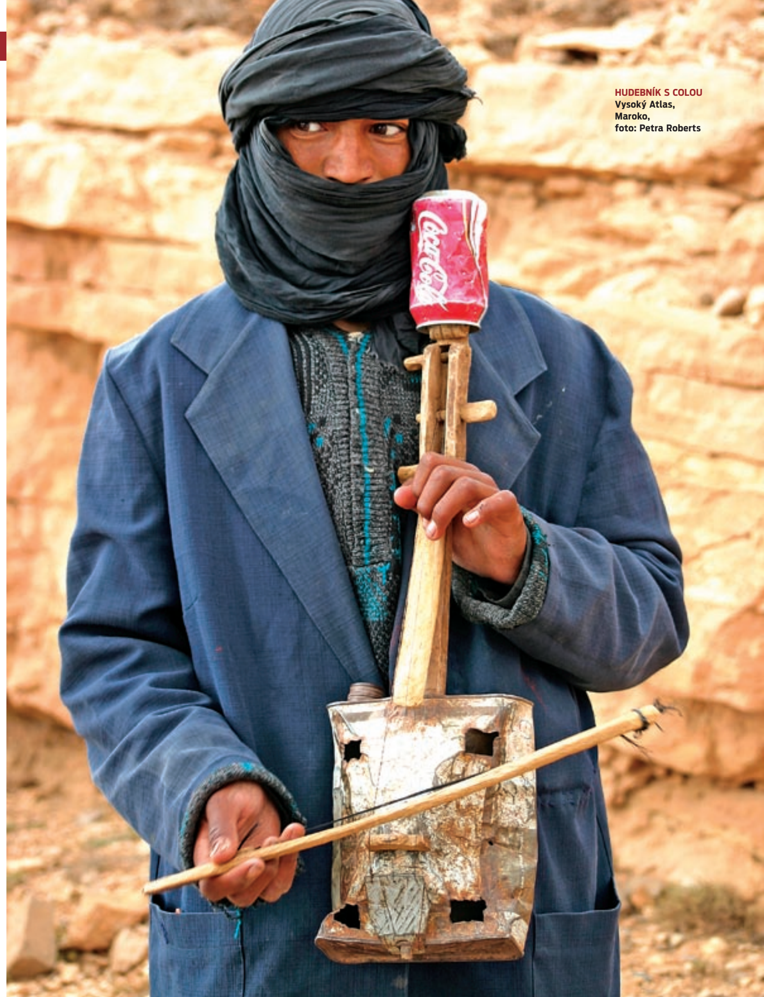
HUDEBNÍK S COLOU Vysoký Atlas, Maroko

Lidé v cizině nemusí mít vždy k cestovatelům-fotografům vřelý vztah. Z psychologického hlediska je opět žena v určité výhodě. Muži v exotičtějších zemích se při portrétování mnohem více stylizují než ženy. Vytvoření skutečné momentky tak bývá i věcí náhody.