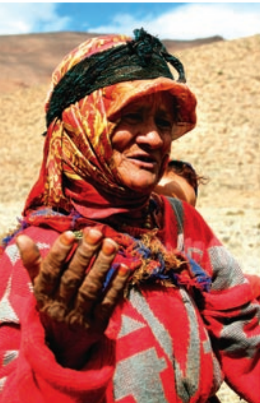
5. OSTRÉ SLUNCE někdy komplikuje techniku záběru. I z tohoto důvodu je vhodné fotografovat na formát RAW a nejvýstižnější gesto vyhledat ze série snímků. Žebrající stařena s vnučkou na zádech v oblasti kaňonů Dadés a Todra v Maroku

Stejně jako v krajině vycházíme při fotografování dokumentárního portrétu v exteriéru z postavení slunce, snažíme se eliminovat rušivé prvky v pozadí, hledáme nejvhodnější úhel pohledu. V kompozici uplatňujeme zejména barvové a světelné charakteristiky, výstižná gesta zachytíme na sérii snímků. Nebojme se užít i velký detail. Dramatické doprovodné prvky v okolí mohou být obohacením snímku, ale nesmí přehlušit vlastní portrét.