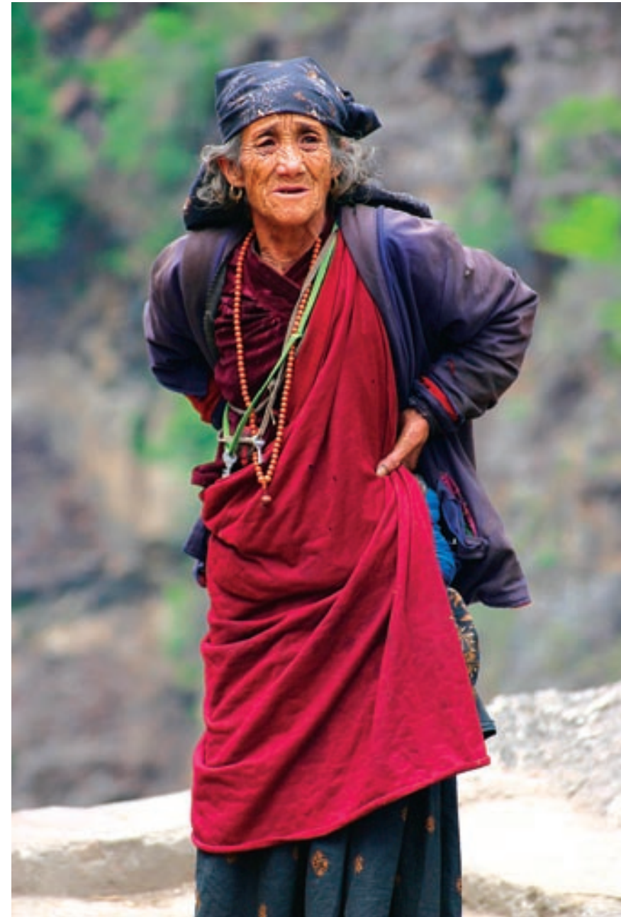
7. ZOBRAZENÍ CELÉ POSTAVY JE TAKÉ PORTRÉTEM. Stařena vyhlíží blízkí se bouři, oblast Annapurny, Himálaje, Nepál.