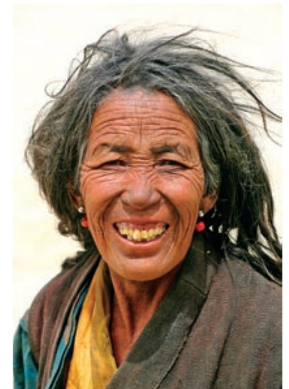
8. ROZHOVOR BÝVÁ DOBRÝM PROSTŘEDKEM PRO NAVÁZÁNÍ KONTAKTU. Žebrající žena u cesty spojující hlavní město Nepálu Káthmándú s hlavním městem Tibetu Lhasou za průsmekem La Lung-la (5124 m. n. m.), Tibet

Pro běžné cestovatelsko-poznávací fotografování není nutná speciální fotografická výzbroj ani speciální úprava aparátu. Rozhodně se vyplatí mít fotonáhradní objektiv uložený a mít vyřešeny otázky záložní energie pro digitál a archivaci svých záběrů. Součástí výbavy na cestách kromě prostředků na čištění optiky je také papírový nebo elektronický zápisník pro zaznamenávání „cestovního deníku“. Také záznam lokace pomocí GPS se pro pozdější archivaci hodí. □