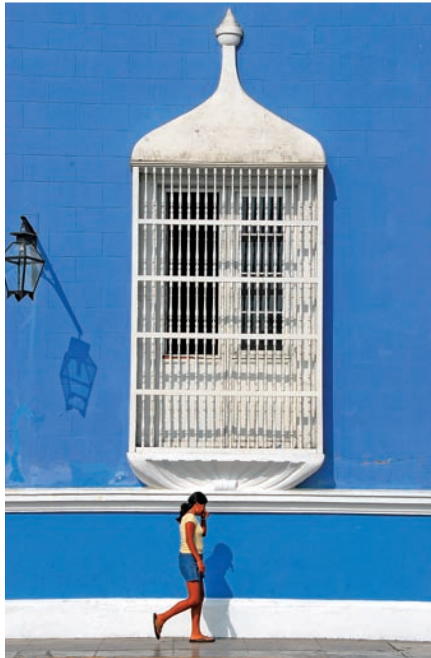
6. BAREVNÉ ŘEŠENÍ CELÉ SCÉNY JE VELMI DŮLEŽITÉ! „Portrét země“ nebo města nemusí vždy vyjadřovat detail tváře obyvatele. Žena ve městě Trujillo ležící na pobřeží Tichého oceánu v Peru